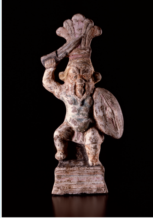
Gestaltung: Museum der Universität Tübingen MUT, Frank Duerr