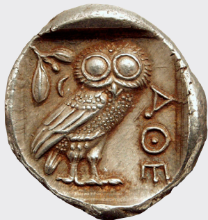
Tetradrachme aus Athen: Öffentlich finanzierte Tagegelder ermöglichten auch armen Bürgern die Teilnahme.

In der athenischen Demokratie entschied die Mehrheit der Bürger – jedoch nur volljährige Söhne zweier Athener, die in ihrem jeweiligen Bezirk registriert waren.